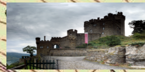
209.3 Burg Sooneck

© GeoBasis-De / L VermGeoP (2018), dl-de / by-2-0 , http://www.Lvermgeo.rlp.de (2018) (DTopo5) (MFO-FRG-18-06-001) © Mega-Forschung.Org (2019) Grafikkarte Route NHB-01 "Auf der Wolfshell" (MFO-FRG-19-10-003)